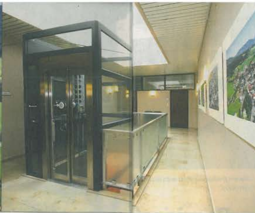
Das ganze Gemeindeamt ist barrierefrei und das Obergeschoss mit einem Lift zu erreichen.