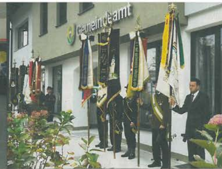
Abordnungen aller örtlichen Vereine gaben der offiziellen Eröffnung einen würdigen Rahmen.