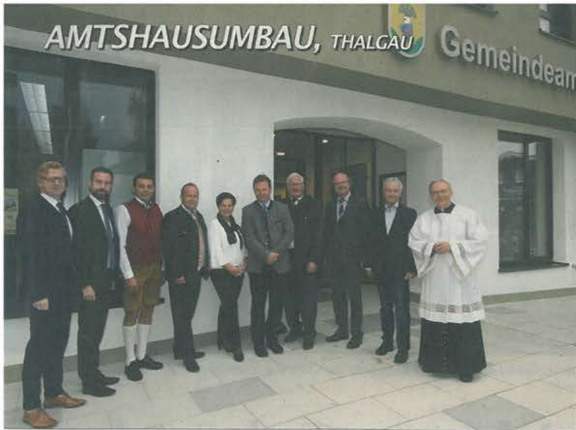
Politiker aus dem ganzen Mondseeland kamen zur Eröffnung des umgebauten und erweiterten Thalgaauer Amtshauses.