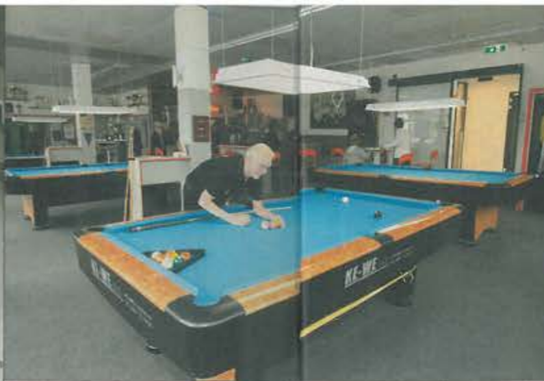
Da wo früher die Post war, da haben jetzt die Billardspieler ihr neues Vereinslokal.