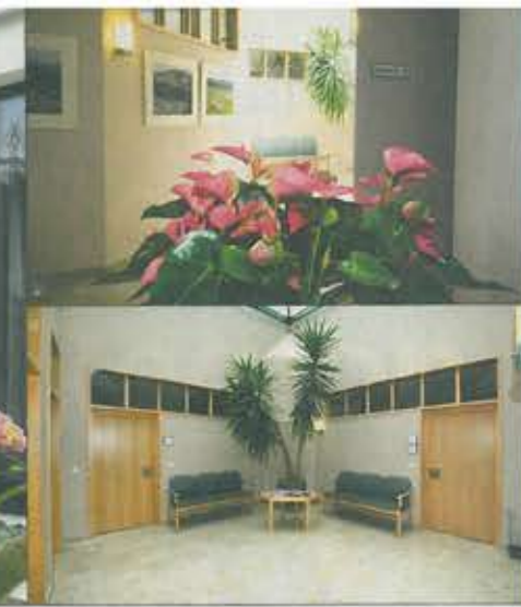
Hell und freundlich sind die Räume im Amtsgebäude.