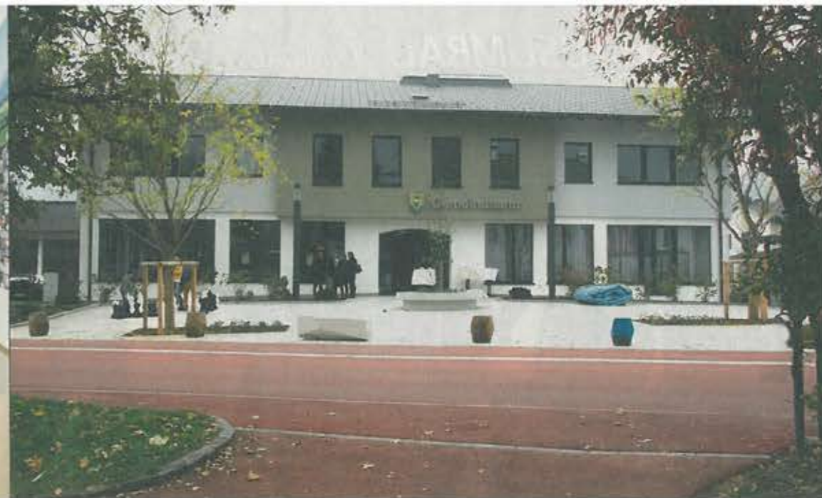
Der Aussenbereich wurde der Umgebung angepasst und bildet jetzt mit der Volksschule ein Ensemble.