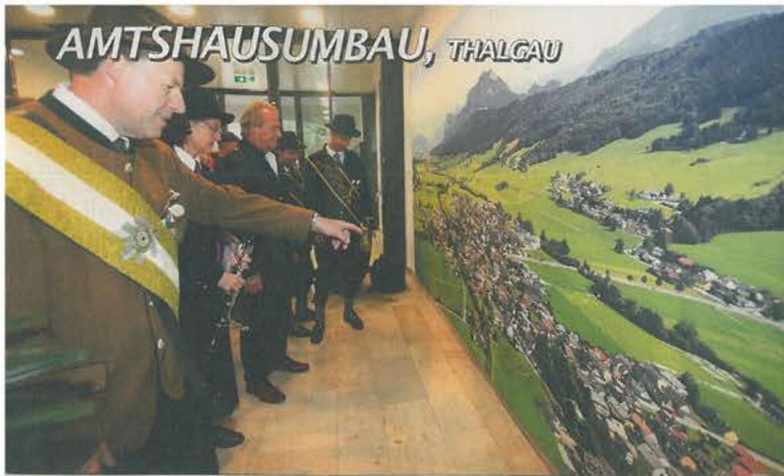
Die große Flugaufnahme der Gemeinde im Foyer des Gemeindeamtes war schon bei der Eröffnung ein Anziehungspunkt.