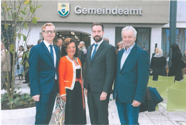
Das neue Gemeindeamt Thalgau wurde eröffnet, - © Franz Neumayr

20. Oktober 2018 13:08 Akt.: 20. Oktober 2018 13:28